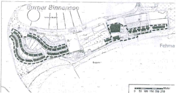
Kartenhintergrund: DTK5 ©GeoBasis-DE/LVermGeo SH

Die Burgruine Glambek, das Haus des Kurgastes, das Meerwasserwellenbad und die Bronzeplastik „Mädchen am Südstrand“ sind - unabhängig vom Ensembleschutz der Sachgesamtheit - Einzeldenkmale gemäß § 2 Abs. 2 und § 8 Abs. 3 DSchG SH. Alle übrigen Objekte sind im Rahmen der Sachgesamtheit geschützt.